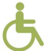
Déficience motrice (fauteuil roulant)