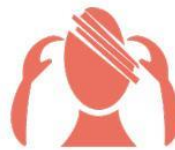
Déficience psychique ou maladie mentale